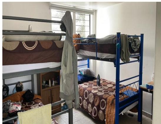
Dormitorio para estudiantes