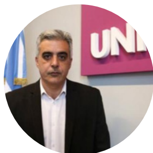
Franco Bartolacci Rector - Universidad Nacional de Rosario.

Palabras de apertura de las autoridades: